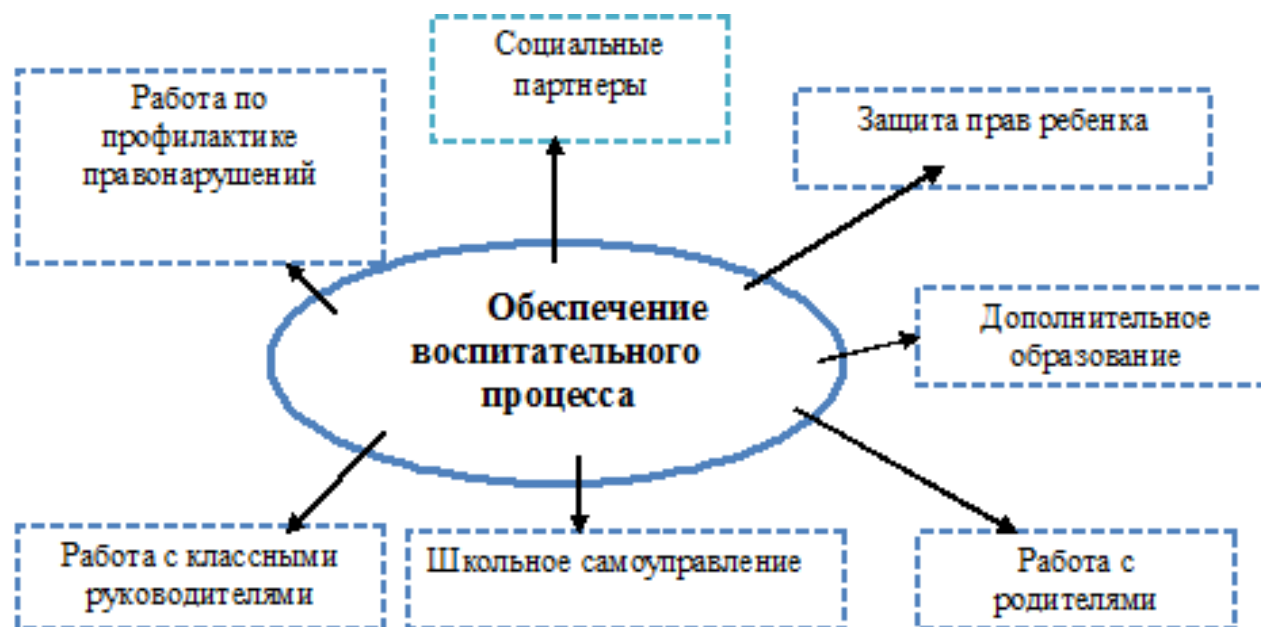
Рис. 5. Обеспечение воспитательного процесса в МБОУ №СОШ № 41”

В 2015-2016 учебном году школа работала по единой методической теме «Системно-деятельностный подход к обучению как средство реализации ФГОС второго поколения. Формирование универсальных учебных действий в контексте усвоения разных учебных дисциплин».