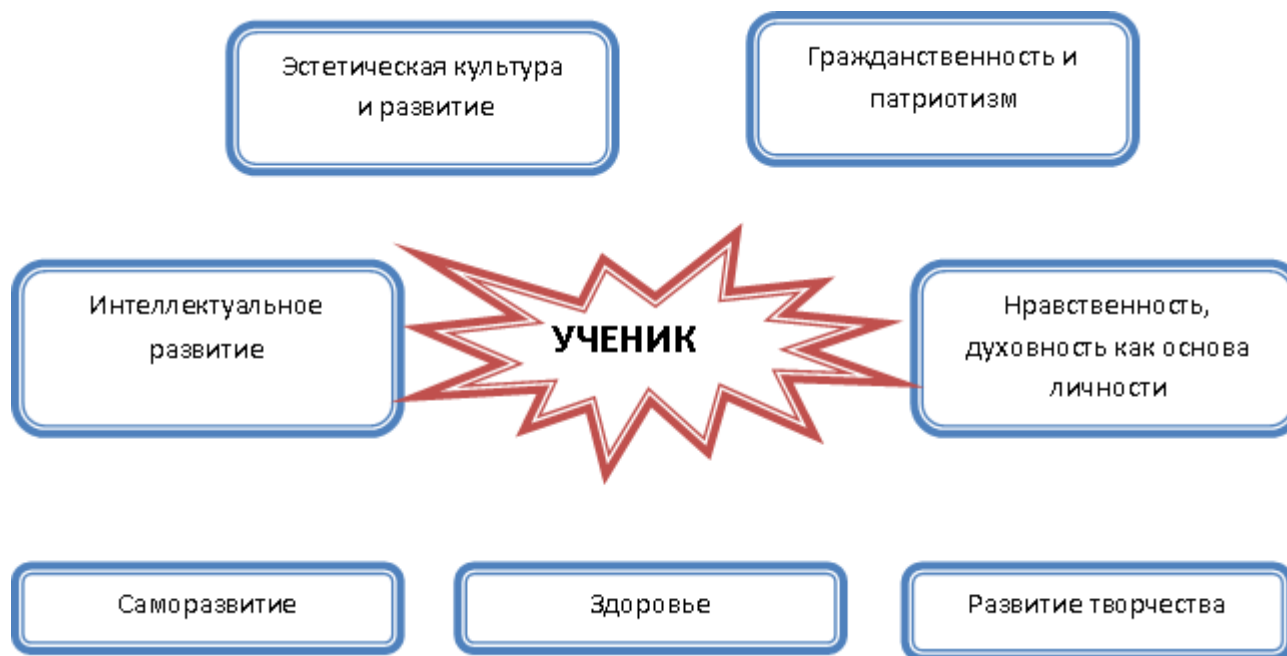
Рис.4. Направления работы с учащимися МБОУ "СОШ № 41"

Концепция воспитательной системы МБОУ СОШ № 41 выстраивается с ориентацией на модель выпускника как гражданина-патриота, образованного человека, личность свободную, культурную, гуманную, способную к саморазвитию. У выпускника школы в достаточной мере будут развиты: личностные качества; нравственные нормы поведения; культура общения в коллективе; потребность в труде; способность к профессиональной деятельности; способность рационально организовывать деятельность способность к сотрудничеству; сформированность познавательных навыков.